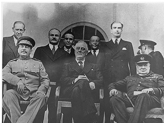
A teheráni konferencia résztvevői 1943-ban

A második világháború az emberiség történetének legpusztítóbb háborúja volt, mely a világ három kontinensén több mint 70 millió halálos áldozatot követelt. Ebből 50 millióan Európában estek áldozatul a harcoknak, üldöztetéseknek, holokausztnak, munkatáboroknak és nélkülözéseknek.