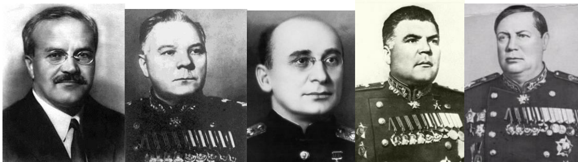
Vjacseszlav Mihajlovics Molotov szovjet külügyminiszter Kliment Jefremovics Vorosilov szovjet marsall Lavrentyij Berija sovjet belügyi népbiztos Malinovszkij marsall a 2. Ukrán front parancsnoka Tolbuhin marsall a 3. Ukrán Front parancsnoka

A Szovjetunióknak hatalmas veszteségeket okozott a háború. Embervesztesége 27- 30 millióra tehető. A szovjet vezetés az újjáépítésben nagymértékben számított a hadifoglyokra és az elfoglalt területek civil lakosságára. Sztálin már a teheráni konferencián, 1943-ban bejelentette igényét mintegy négymillió hadifogoly munkába állítására az újjáépítésben.